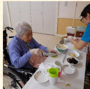
10月はあんみつを作りました。