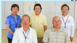
シルバーリハビリ体操様