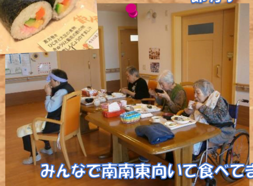
みんなで南南東向いて食べてます