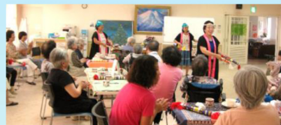
とんとんくらぶ様