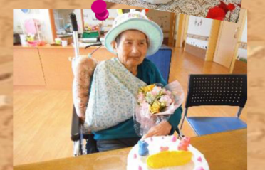
のどにつまらないよう気をつけて、召し上がっていただきました