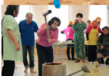
つきたてのお餅 おいしそう！